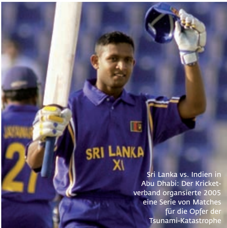
Sri Lanka vs. Indien in Abu Dhabi: Der Cricketverband organisierte 2005 eine Serie von Matches für die Opfer der Tsunami-Katastrophe

Bei aller Begeisterung für das neu entdeckte Wundermittel Sport im Kampf für eine bessere Welt müssen auch die Grenzen aufgezeigt werden. Sport per se ist nicht gesund, friedlich oder anti-diskriminierend, sondern besitzt lediglich positive Potenziale, die es zu entwickeln gilt. Eine Studie in Deutschland hat gezeigt, dass Jugendliche, die in Sportvereinen organisiert sind, mehr Alkohol