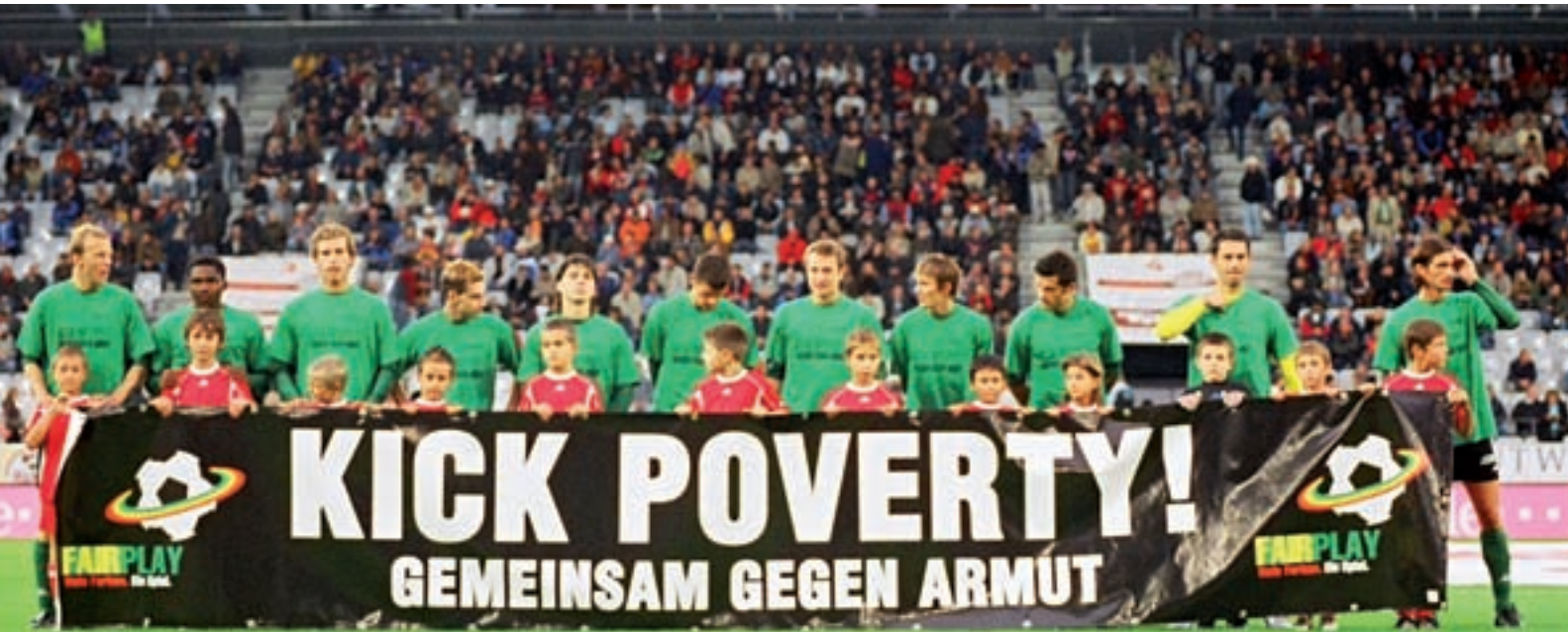
Der FC Wacker und seine Fans beteiligten sich im UNO-Jahr des Sports 2005 an der FairPlay-Stadionaktion unter dem Motto „Kick Poverty“.

konsumieren als ihre nicht Sport treibenden Altersgenossen – Sport als Einstiegsdroge sozusagen.